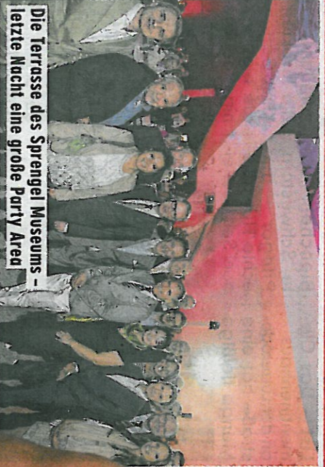
Die Terrasse des Sprengel Museums - letzte Nacht eine große Party Area